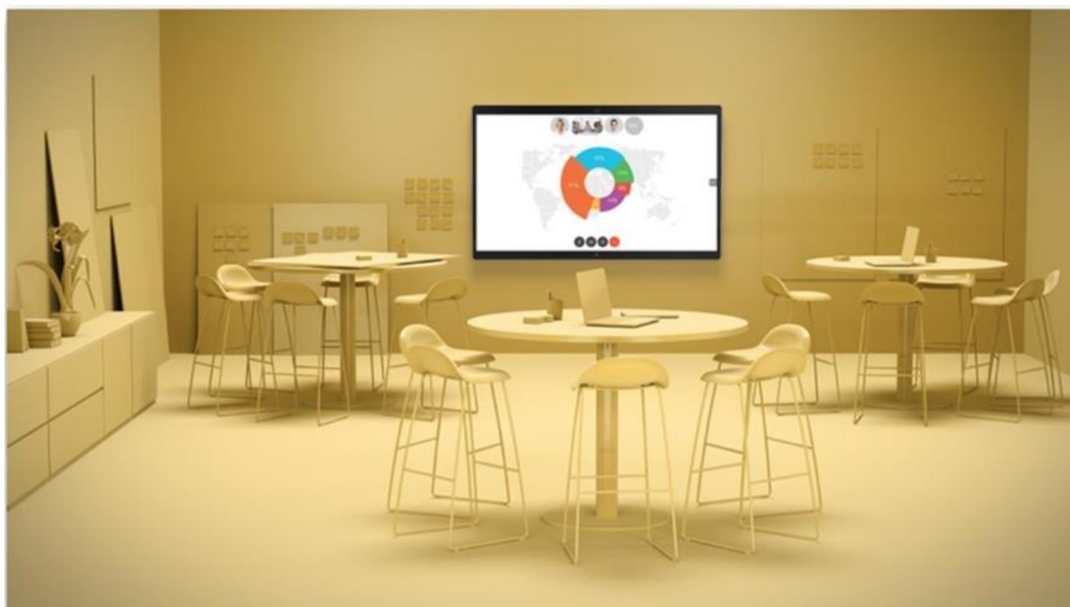
图 1. 思科 Webex Board 85S上的白板功能

思科 Webex® Board 是一款高度集成的一体化设备，为您提供与会议室中团队开展协作所需的一切功能。您可以无线演示幻灯片，使用电子白板，进行视频和音频通话。配合安装 Cisco Webex应用程序的设备，Webex® Board 可以与您的虚拟团队建立安全的连接，因此您可以随时随地参加会议和查看内容。Webex Board 85S *专为大型空间而设计，如礼堂、培训会场、教室等协作空间。Webex Board 同时还提供屏幕尺寸为55英寸和70英寸的型号选项。