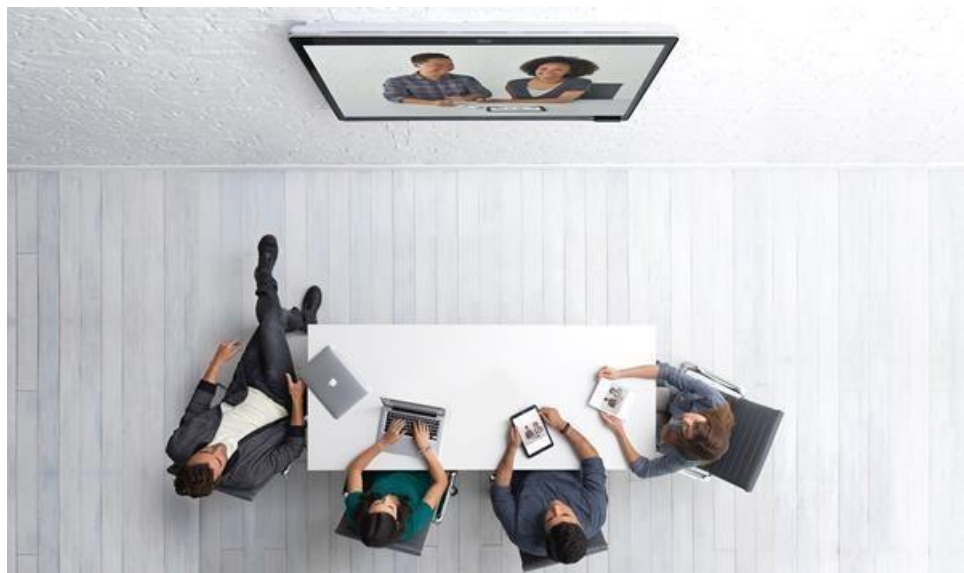
图 2. 使用思科 Webex Board 召开视频会议

、嵌入式麦克风和电容式触摸屏界面，兼具智能性、独特性和可用性，适用于各种规模的会议室。这款最新的思科协作设备支持无线共享和 Wi-Fi 连接，其设计最大程度地减少线缆的使用，外形简洁典雅。同时，通过提供触摸体验，便于团队进行多样化的协作。思科 Webex Board 不仅外观优雅，便于使用，而且经济实惠，易于安装和部署，无疑是各类会议室的理想协作设备。