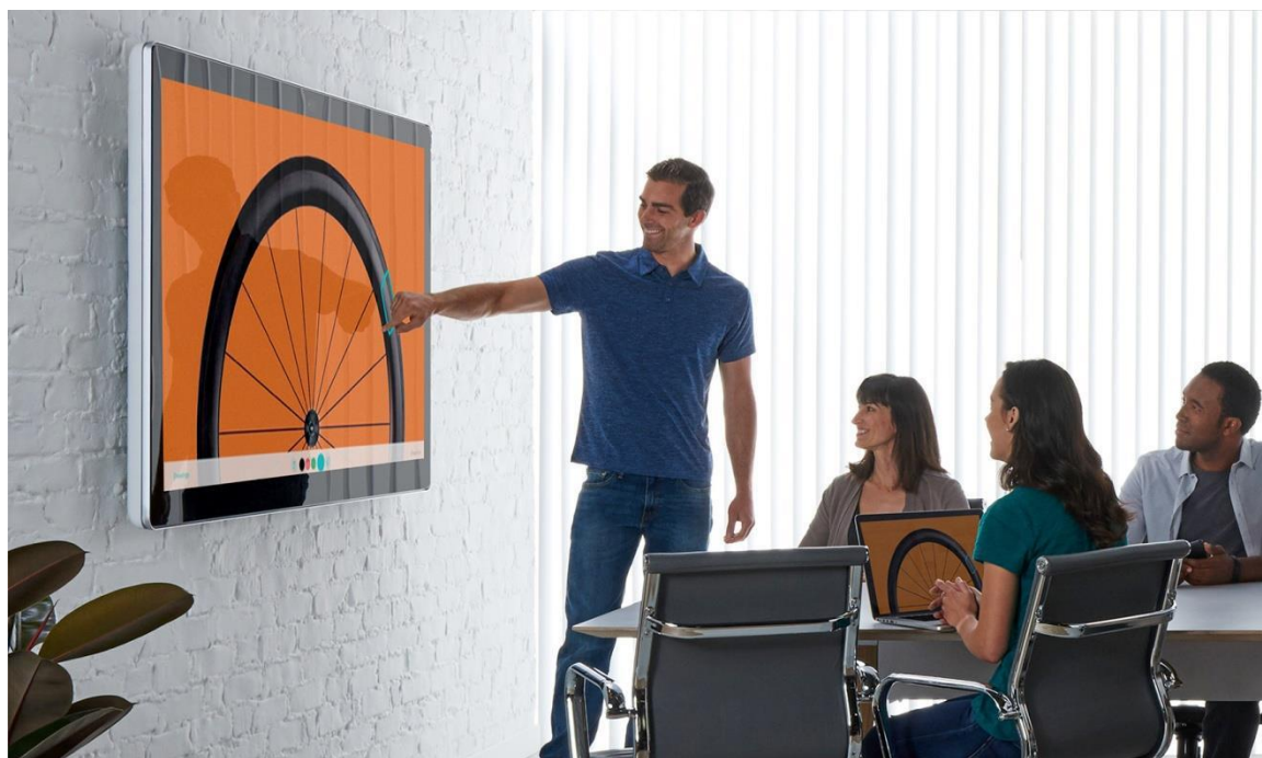
思科 Webex Board 70S 上的白板功能